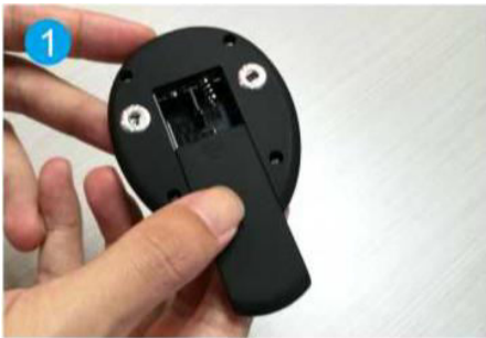
1. Otevřete prostoru pro baterie