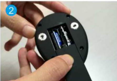
2. Vložte baterie (2xAAA)