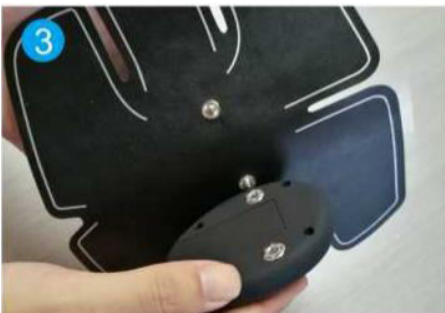
3. Připojte regulátor k jednotce